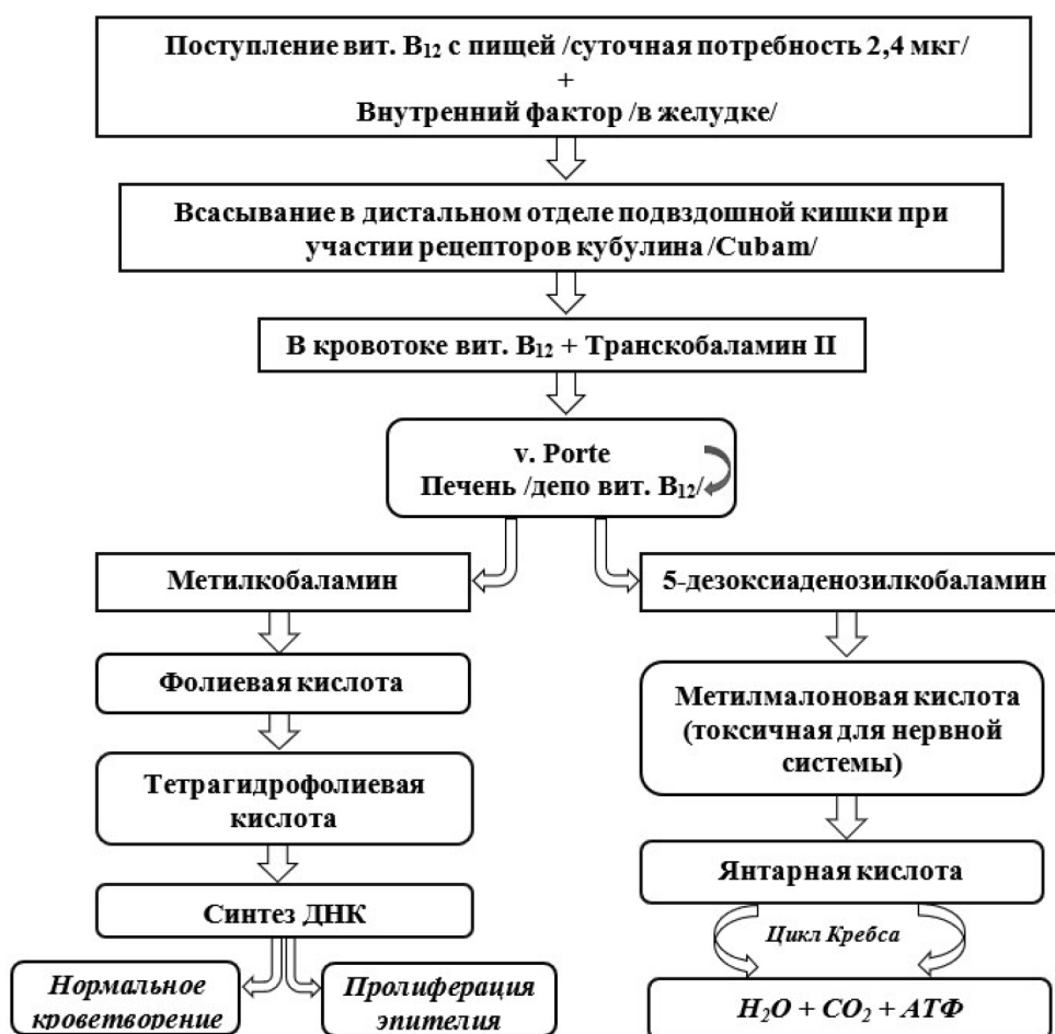
Рис. 1. Кинетика витамина B_{12} в организме человека

Заболеваемость самой B_{12} -дефицитной анемией составляет от 9 до 17 человек на 100 000 населения в год в целом. По мере увеличения возраста частота диагностирования B_{12} -дефицитной анемии увеличивается. Так, например, если в молодом возрасте 30–40 лет она достигает 1 на 5000 человек (0,02 %), то в возрасте 60–70 лет – 1 случай на 200 человек (0,5 %) от всего населения, а в возрасте старше 75 лет – до 4 % [5]. Еще интересен факт, что частота положительного теста на наличие аутоиммунных антител к внутреннему фактору у лиц в возрасте до 40 лет составляет 1,48 %, в то время как у пациентов старше 40 лет – 5,66 % ( P = 0,006 ). При этом существенной разницы в зависимости от пола не определяется ни по частоте дефицита витамина B_{12} (3,83 % для мужчин и 2,69 % для