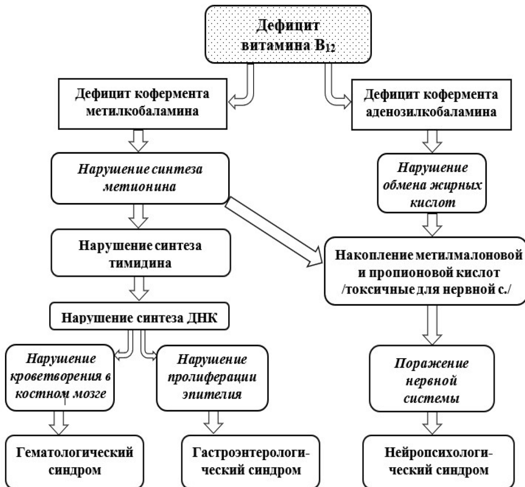
Рис. 2. Схема патогенеза В 12 -дефицитной анемии Fig. 2. Scheme of pathogenesis of В 12 -deficiency anemia